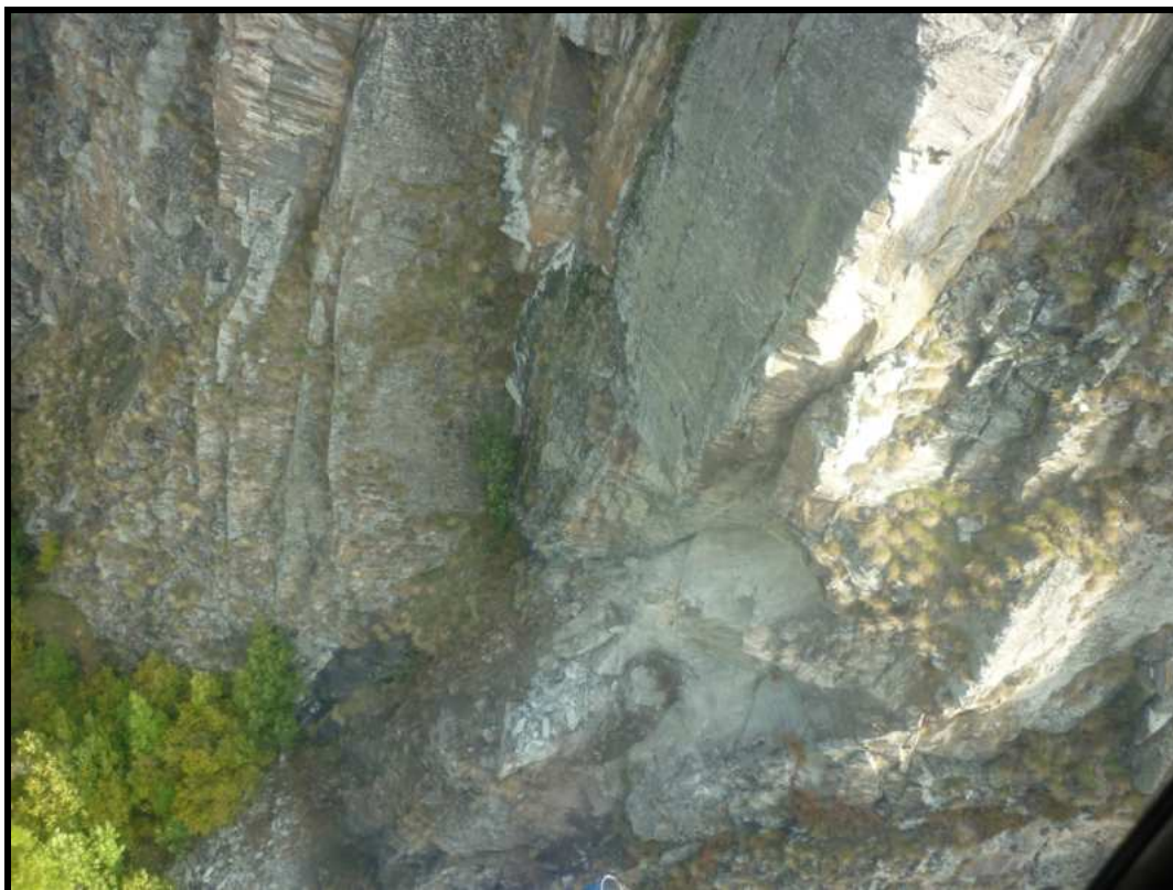
Foto4 Particolare di una nicchia di distacco