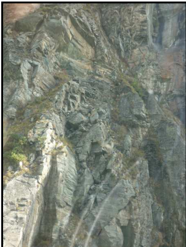
Foto 5 Evidenti fratturazioni della parete con formazioni di blocchi in precario equilibrio