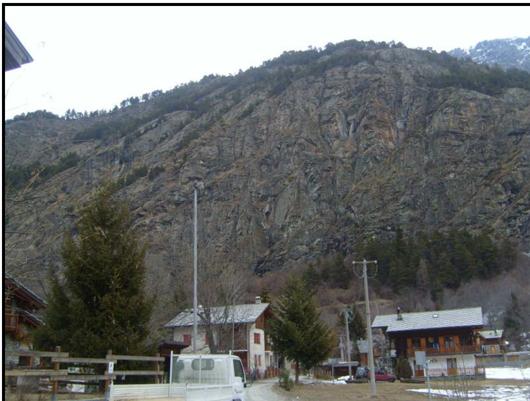
Foto 1 Vista dell'intera parete soggetta a fenomeni di instabilità