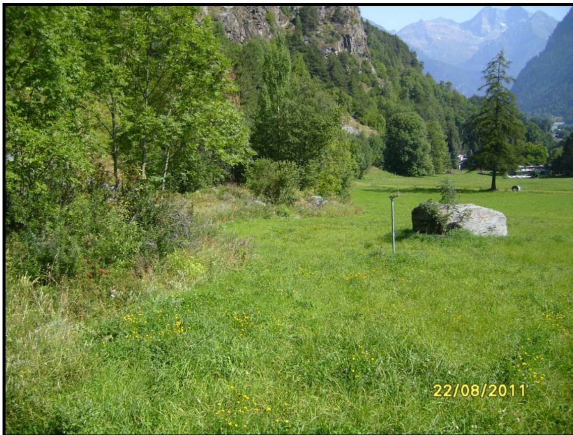
Foto 11 Blocco di grandi dimensioni in località Gerbis