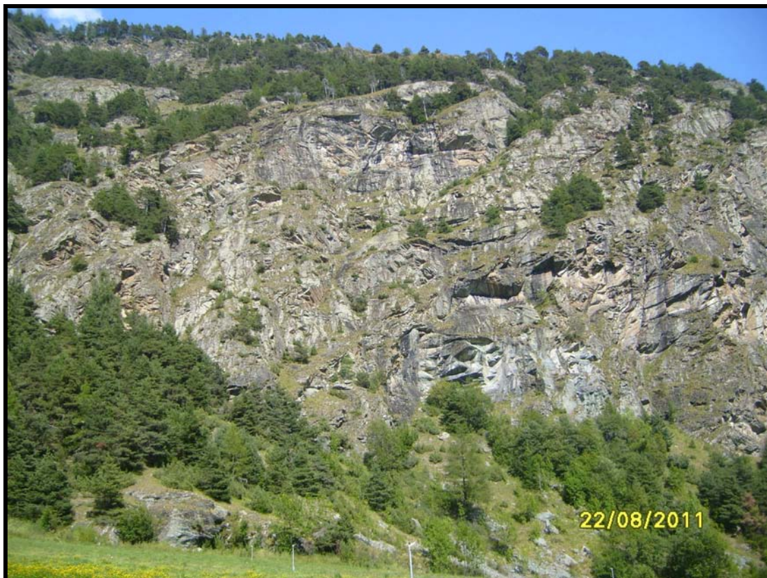
Foto 9 Parete in località Gerbis