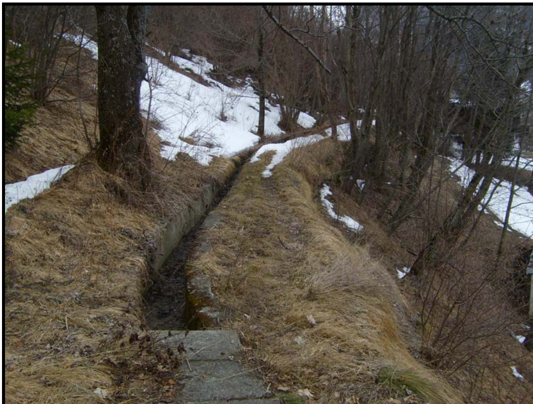
Foto 3 Canale irriguo a monte dell'abitato di Escarra