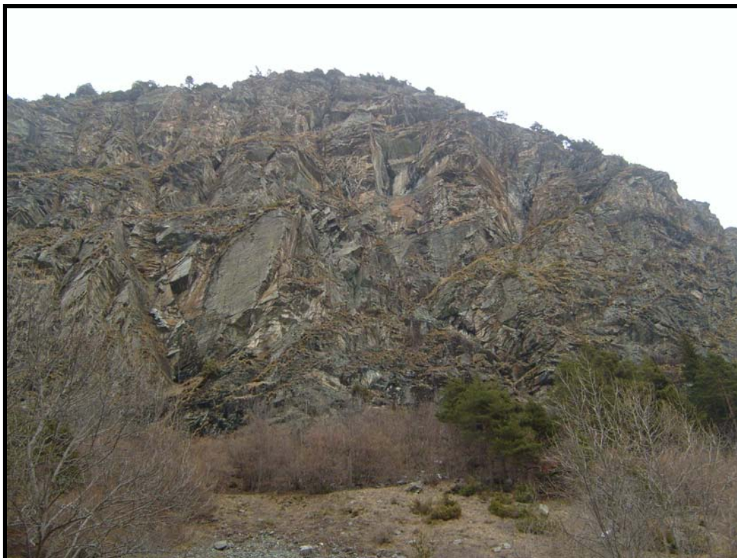
Foto 2 Vista dell'intera parete soggetta a fenomeni di instabilità