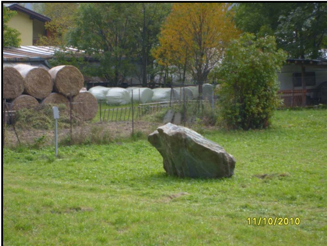
Foto 7 Masso di grosse dimensioni che si è staccato dalla parete nel mese di ottobre e ha quasi raggiunto il centro abitato