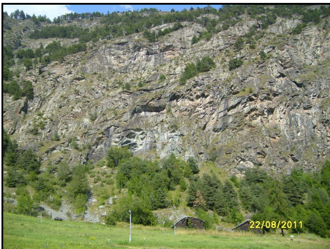
Foto 10 Parete a monte dei rascards in località Gerbis