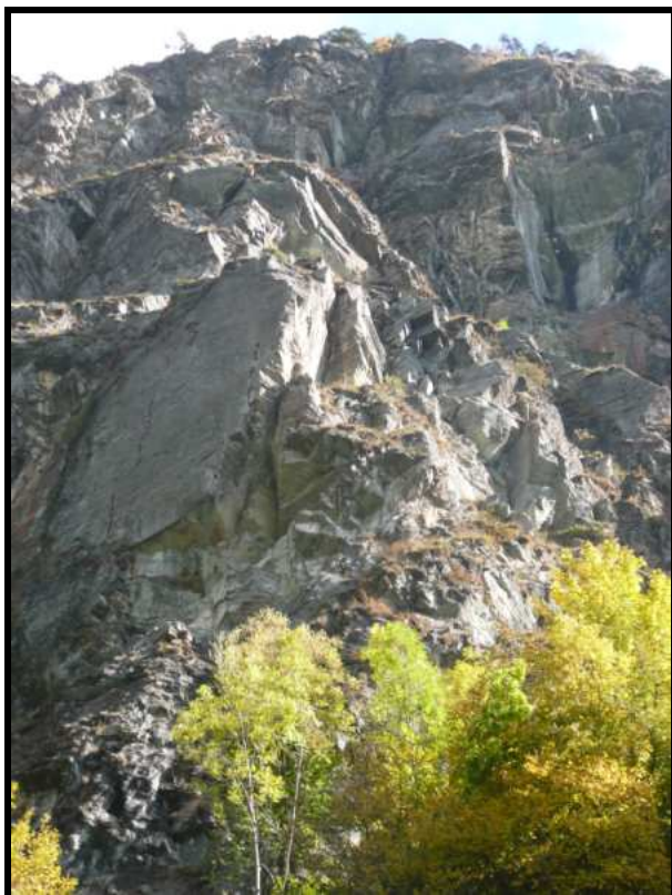
Foto 6 particolare di una delle nicchie da dove si sono staccati i massi nel mese di ottobre