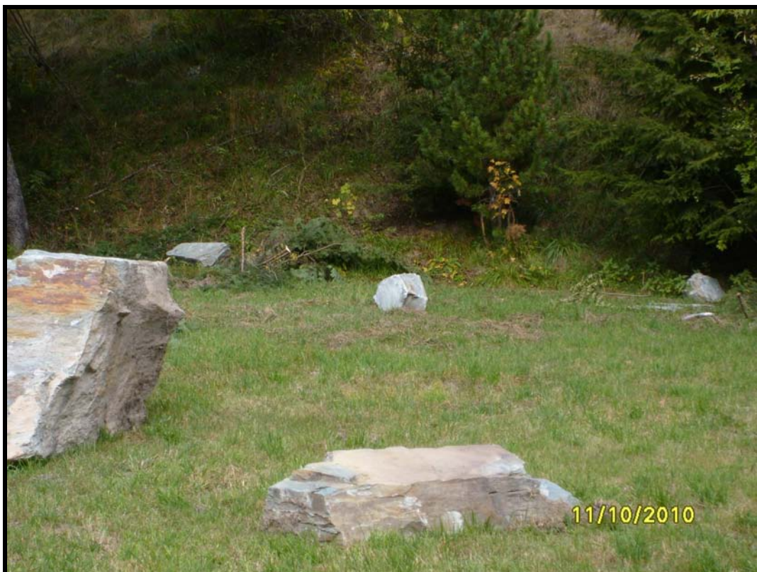
Foto 8 Il fenomeno di instabilità di ottobre è stato caratterizzato dal distacco di blocchi di grossa pezzatura